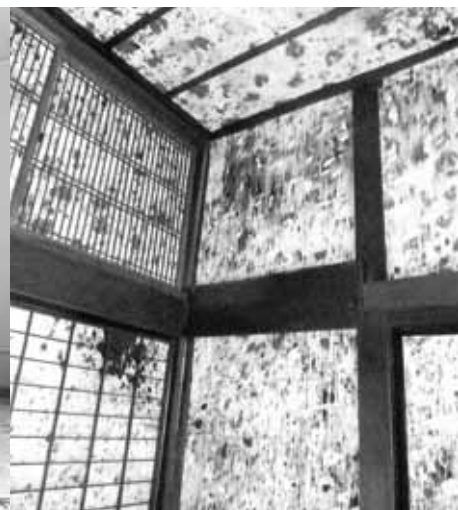
大つた屋・藤屋 展示作品