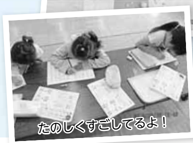
たのしくすごしてるよ!