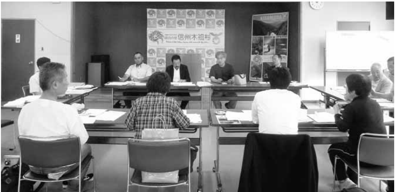
木祖村ブランド認証制度審査員名簿