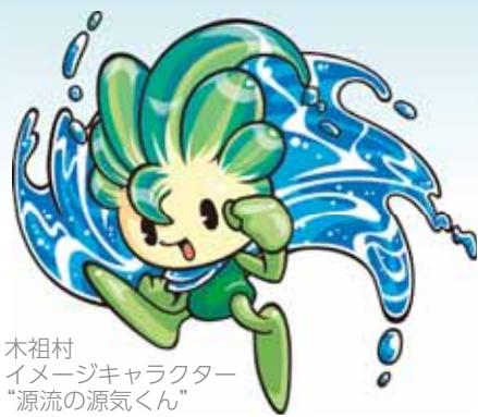
木祖村 イメージキャラクター “源流の源気くん”